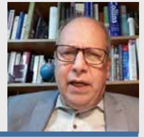
Isaac Bigio Político, economista e historiador

El canciller habla de defender la democracia cuando él propició un golpe para impedir que Dina llegue a la vicepresidencia, alentó el golpe y la cárcel al presidente constitucional Castillo, avala la excarcelación del dictador Fujimori y su presidenta es la más impopular de toda la historia mundial.