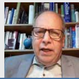
Isaac Bigio Politólogo, economista e historiador

Los peruanos debemos pagar por todos esos lujos al Congreso más corrupto e impopular que hemos tenido (y también de todo Occidente). En vez de aumentar los ingresos a esos congresistas que no cumplen con sus promesas y cambian de bando cuando les place, se debiera poder tener el derecho a revocar a todos ellos, así como a cambiar todo este Legislativo y Ejecutivo..