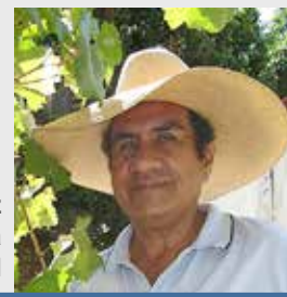
Óscar Vásquez Periodista y exasesor presidencial