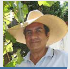
Óscar Vásquez Periodista y exasesor presidencial